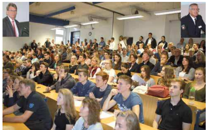
Interessiert hörten die neuen Studenten an der FHVD die Ausführungen der Vortragenden.