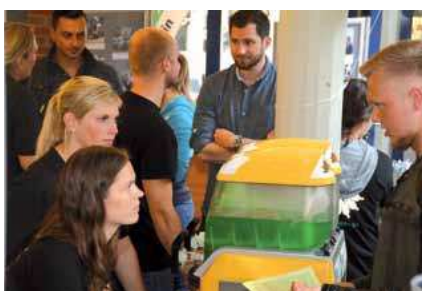
Gespräch zwischen GdP-Vertrauensleuten und Studenten.